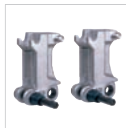
Borediameter på inntil 1000 mm med ModulDrill-distanseplater