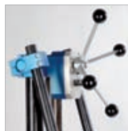
Kraftbesparende boring takket være totrinns mategir i=1:2 og i=1:9