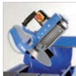
Svingbart saghode gir mulighet for 45° gjæringsnitt