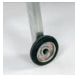
To robuste ben med hjul sørger for best mulig manøvrerbarhet på bruksstedet