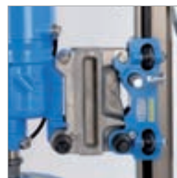
ModulDrill-distanseplate for hull med en diameter på inntil 500 mm