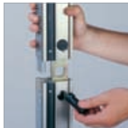
Kolonneforlengelser fra 230 til 910 mm